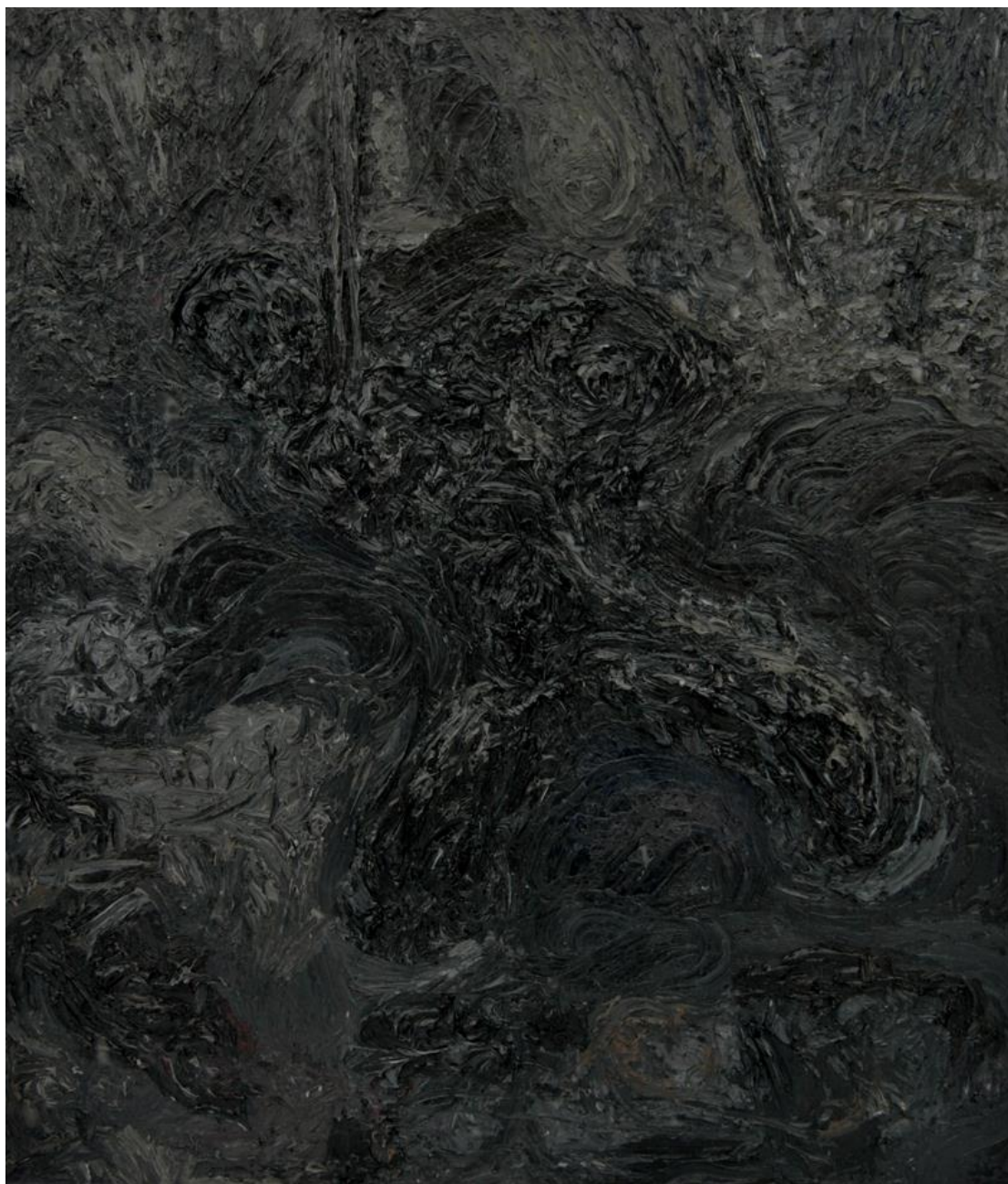
Berszán Zsolt: Untitled , oil on canvas 150 x 130 cm, 2014

Poszthumán gondolatok Berszán Zsolt műveiről